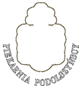
Tradycyjnie Naturalnie Zdrowo Piekarnia Podolszyńscy