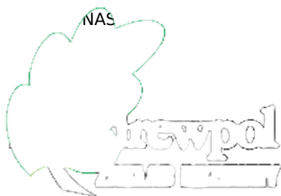
Firma ANDREWPOL Andrzej Pryczynicz

Głównym źródłem finansowania Powiatowego Funduszu Stypendialnego są środki budżetu powiatu. Fundusz ma jednak charakter otwarty: każdy, kto chciałby pomóc w realizacji marzeń uzdolnionych młodych ludzi może dokonać wpłaty na konto: 54 1240 5211 1111 0000 4928 4061. Zachęcamy wszystkich do pomocy.