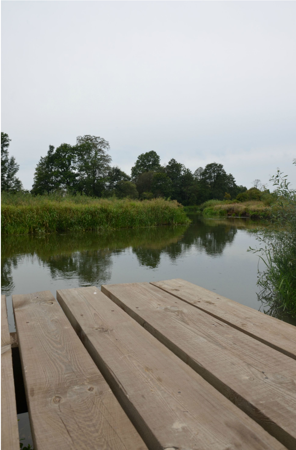
Rzeka Narew to dziś kajakowa przystań