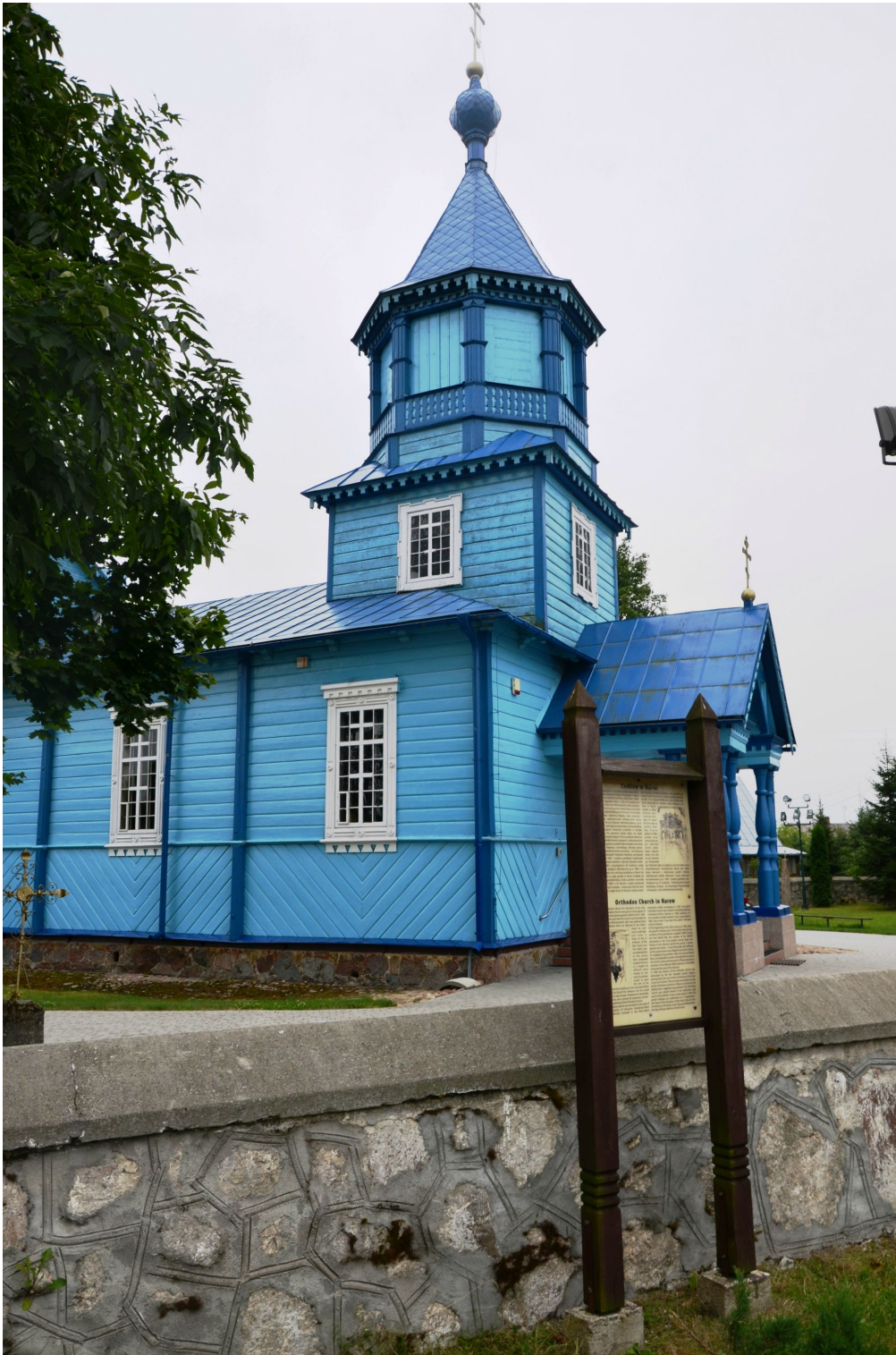
Cerkiew w Narwi