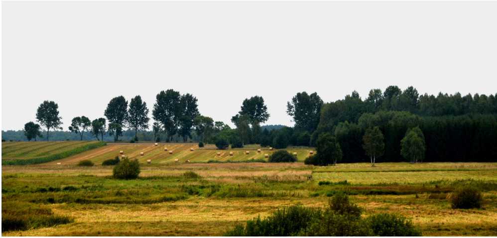
Krajobraz okalający Narew