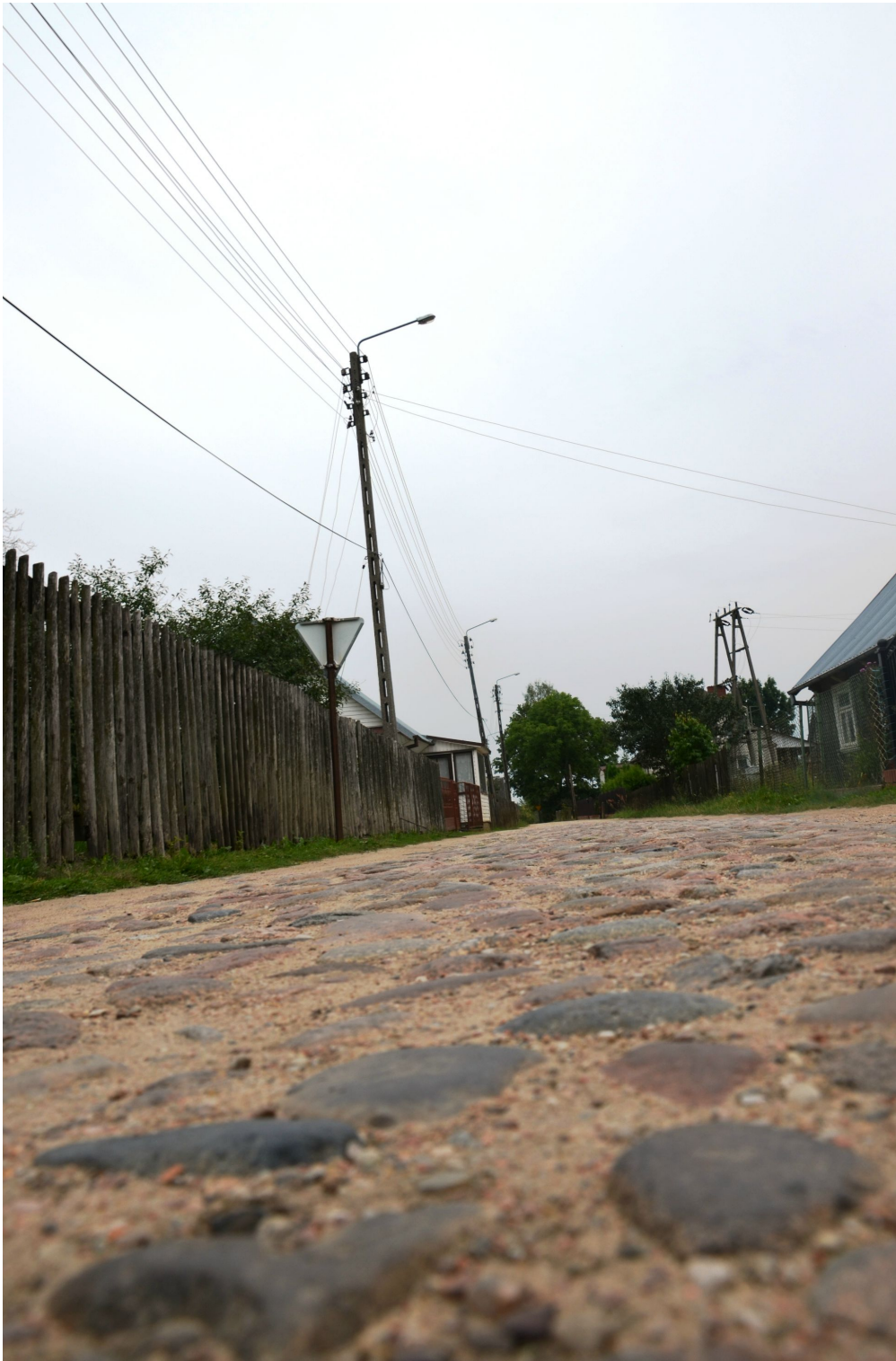
Jedna z ulic odchodzących od rynku