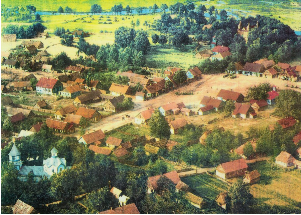
Narew - panorama miasta z początku XX w.