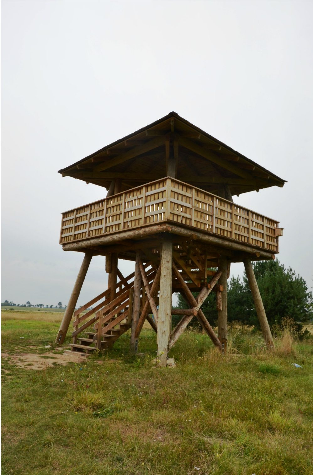
Wieża widokowa przy rzece