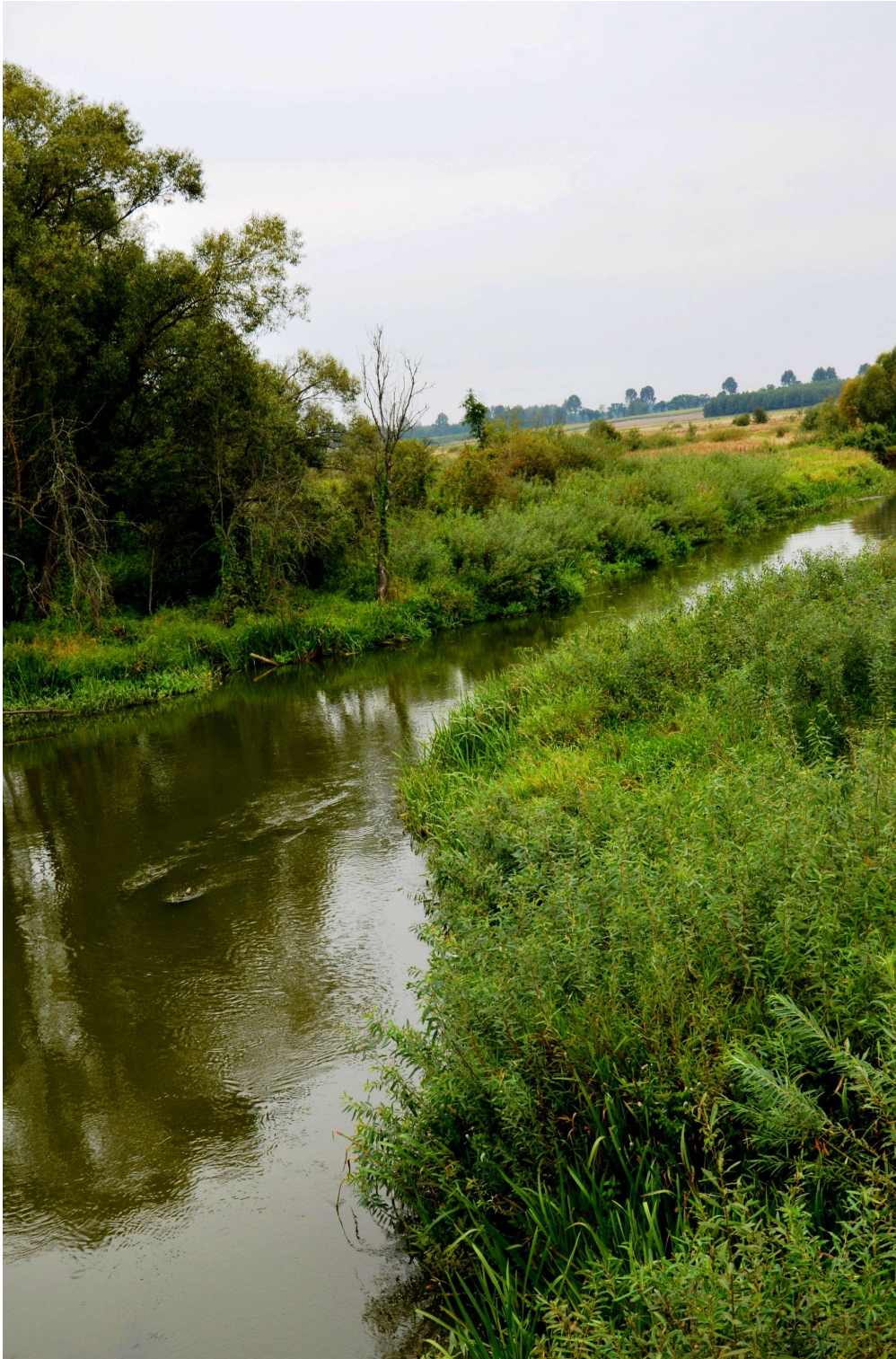
Rzeka Narew - przed wiekami ważny szlak komunikacyjny