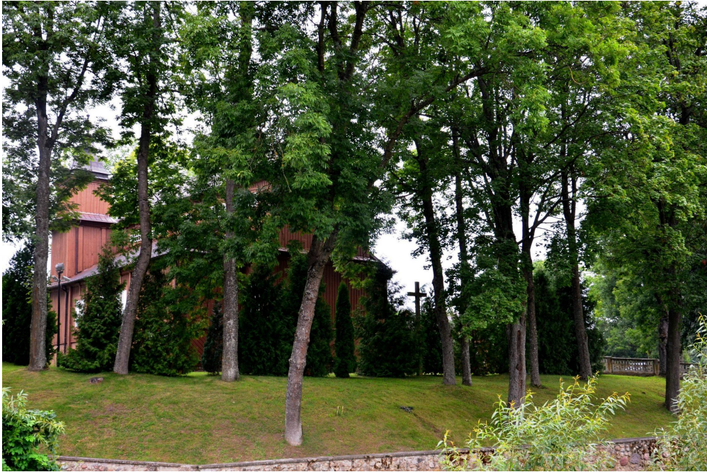
Tył zabytkowego kościoła. Za wzniesieniem rozpościera się widok na rzekę Narew